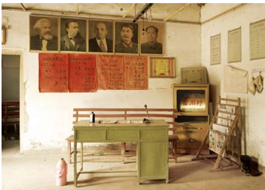
Qu Yan "Power Space - Wuzhuang village Head Office, Tushan Town, Pizhou County, Jiangsu Province", 2005