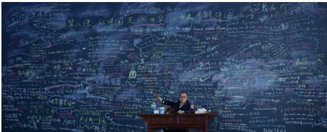
Wang Qingsong “Follow Me” 2003