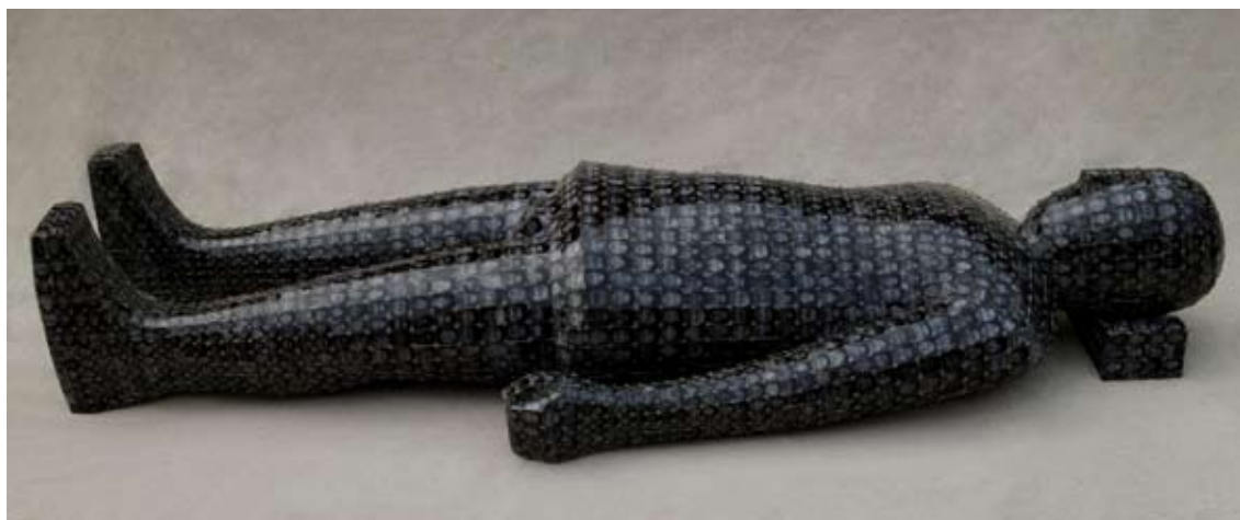
Bai Yiluo "Fate-4", 2007