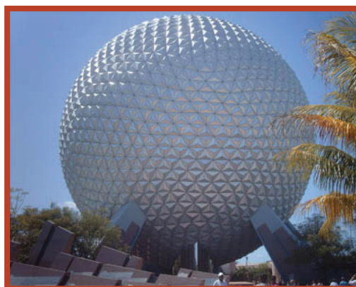
Geosphere, Epcot Center - Florida Buckminster Fuller