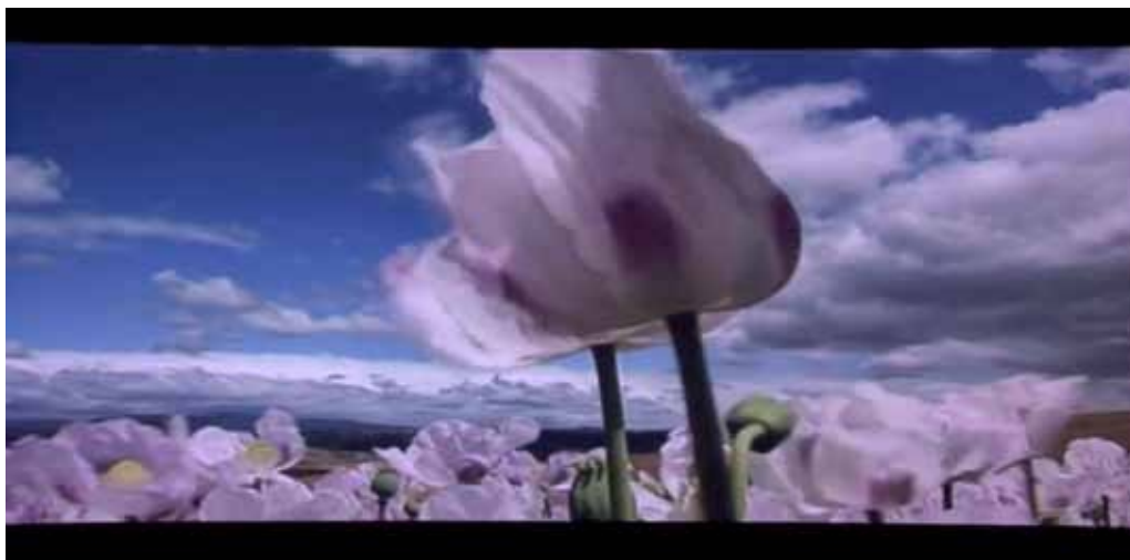
Fiona Foley, videostill